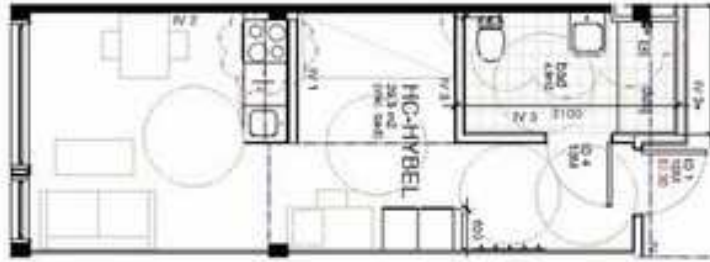
To eksempler for studenthybler med HC standard

I situasjoner hvor det ikke er mulig å oppnå helt de samme kvalitetene, for eksempel i boliger med begrenset størrelse bør det tilstrebes en så stor grad av tilgjengelighet som mulig. Fortrinnsvis bør en slik tilretteleggingen være tilgjengelig for besøkende.