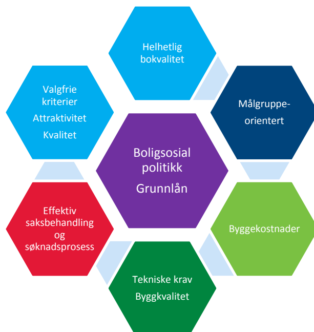
Figur 1: Illustrasjon av viktige momenter i utvikling av nye kriteriesett for Husbankens grunnlån (Illustrasjon, SINTEF).

Det er et ønske om å effektivisere søknads- og behandlingsarbeidet når det gjelder Husbankens grunnlån. På samme tid må man sikre at kvaliteten på boligene blir like god, eller bedre, enn før. Det er i dette kapittelet sett på hvordan søknadsarbeidet og behandlingstiden kan endres og effektiviseres basert på det nye kriteriesettet. Det overordnede målet er at bokvaliteten blir bedre og at prosessene går raskere, samtidig som man oppnår den politiske målsetningen som er satt for grunnlånet og Husbanken.