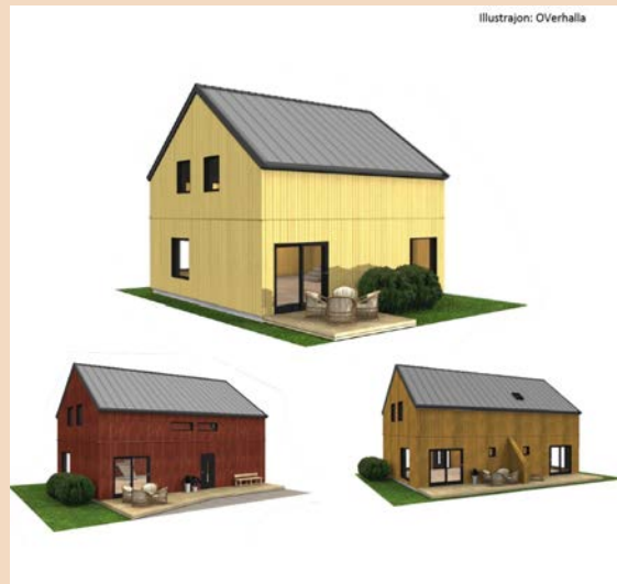
Bilde - Oversikt over typhusene til Træna 365-bolig-prosjektet. Illustrasjoner Overhalla bygg/ Entreprenør Harald Nilsen.