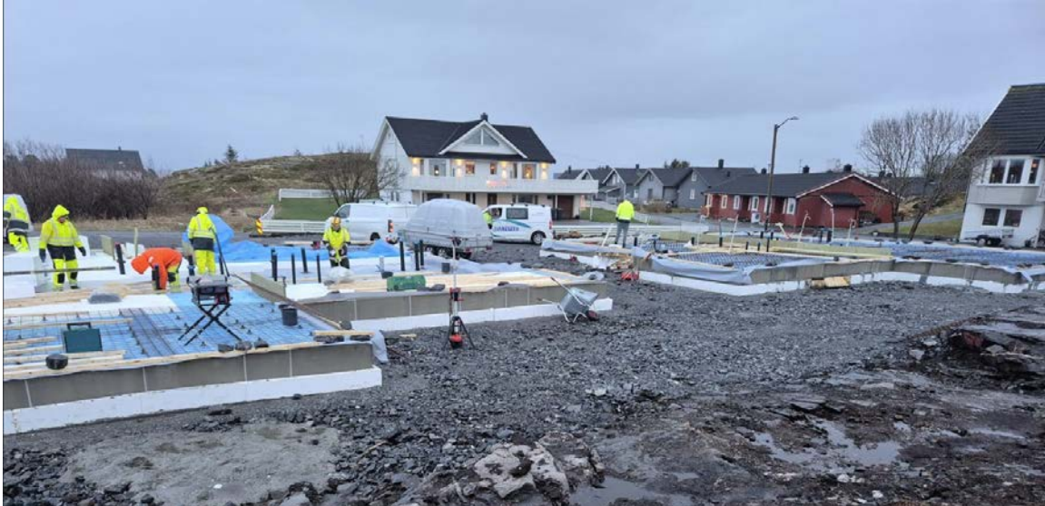
Bilde - Nordbohus er igang med fundamentering for 4 boenheter i Trænas første borettslag.