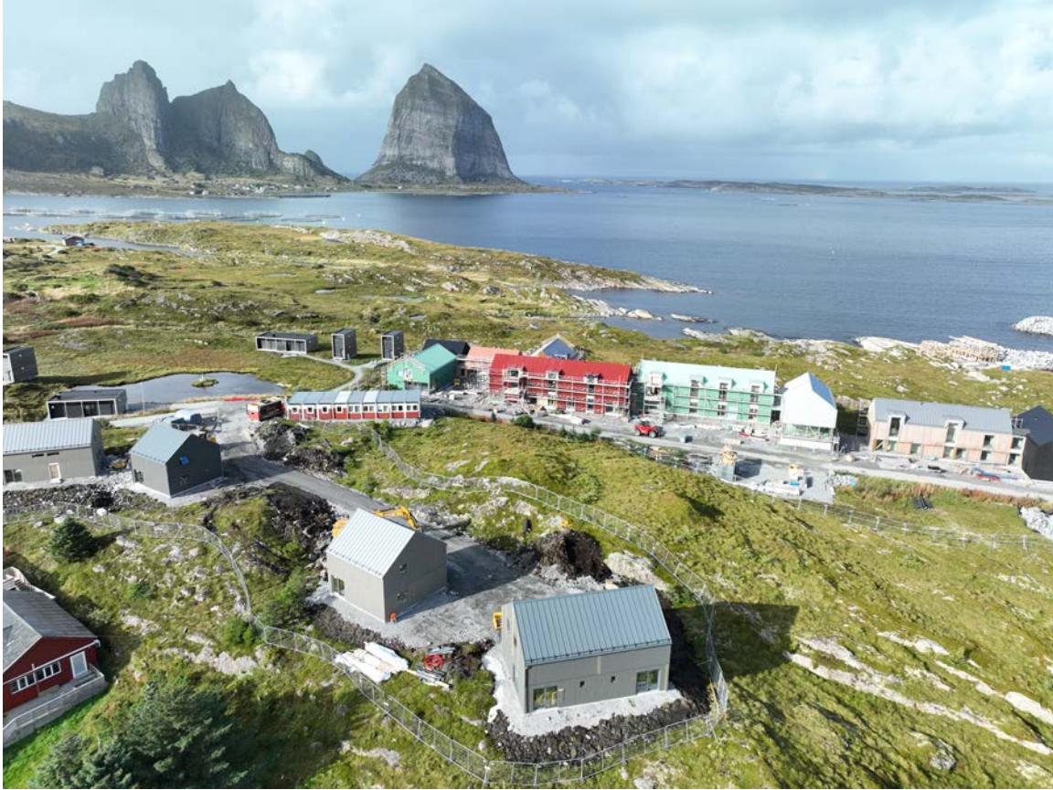
Bilde fra byggeprosessen av boligene til Træna 365. Til venster og nederst i bildet ses 4 bolighus med totalt 5 boenheter.