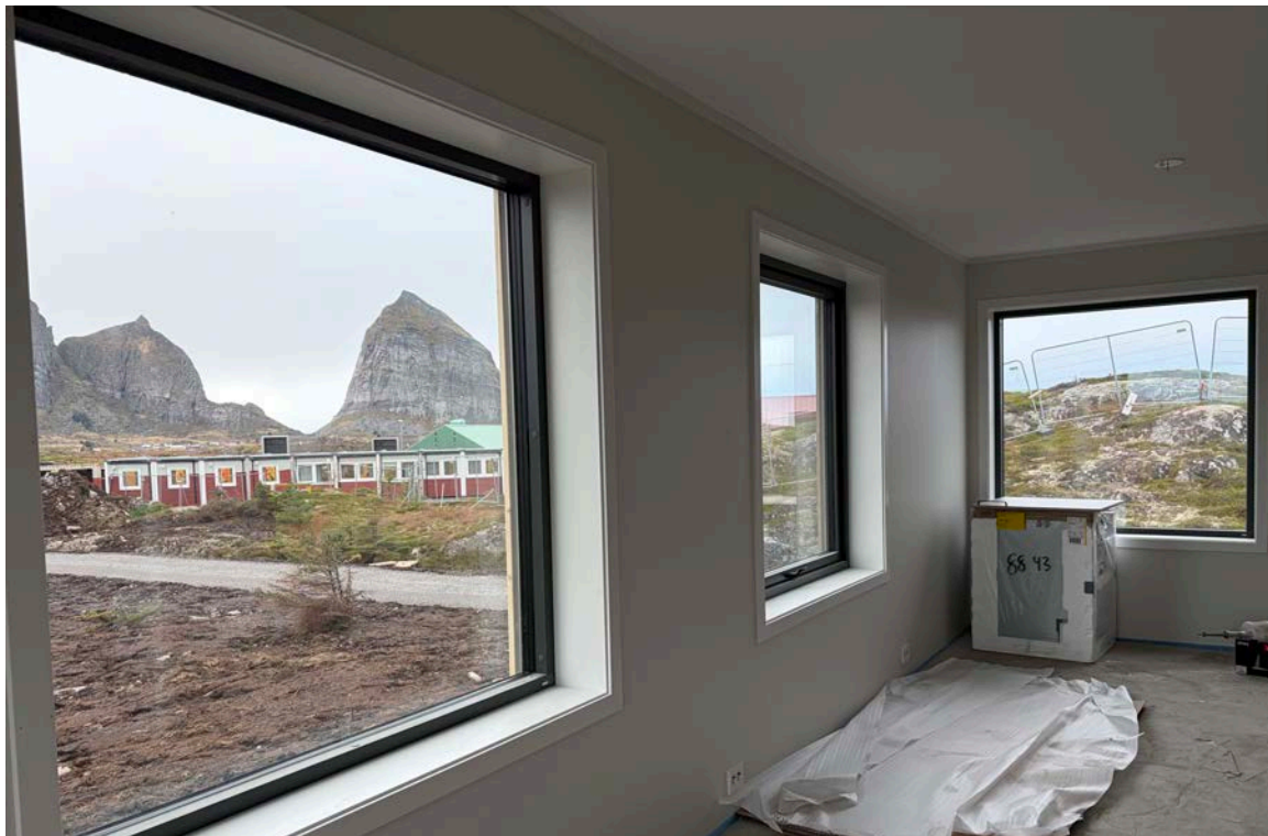
Bilde - En av eneboligene I Træna 365 sitt boligprosjekt, her på inspeksjon før overtakelse. (Foto Moa Björnson, November 2025)