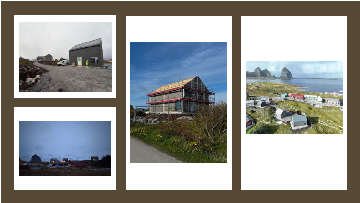
Bilde – Fotografier fra byggeprosessen av boligene til Træna 365.